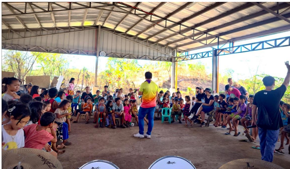
Kinder und Jugendliche in der "Jesus Mountain Church"

mit dabei waren, haben wir an einem Nachmittag Kinder und Jugendliche in der "Jesus Mountain Church" versammelt.