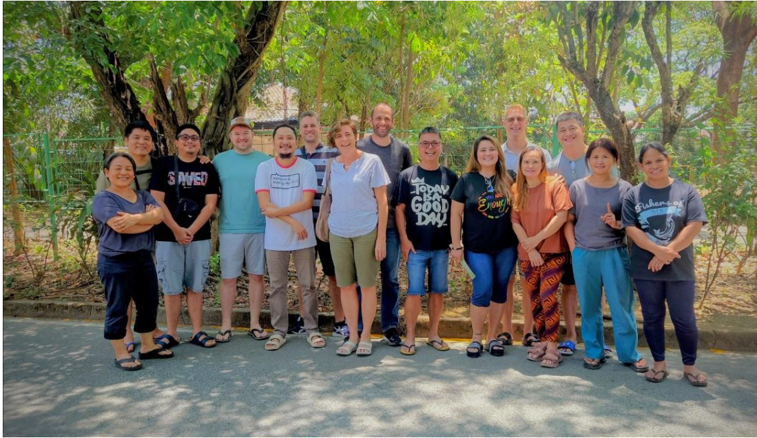
Einige von unseren Mitarbeitern von „HELP International Philippinen“ zusammen mit Leitern aus Deutschland und Thailand.